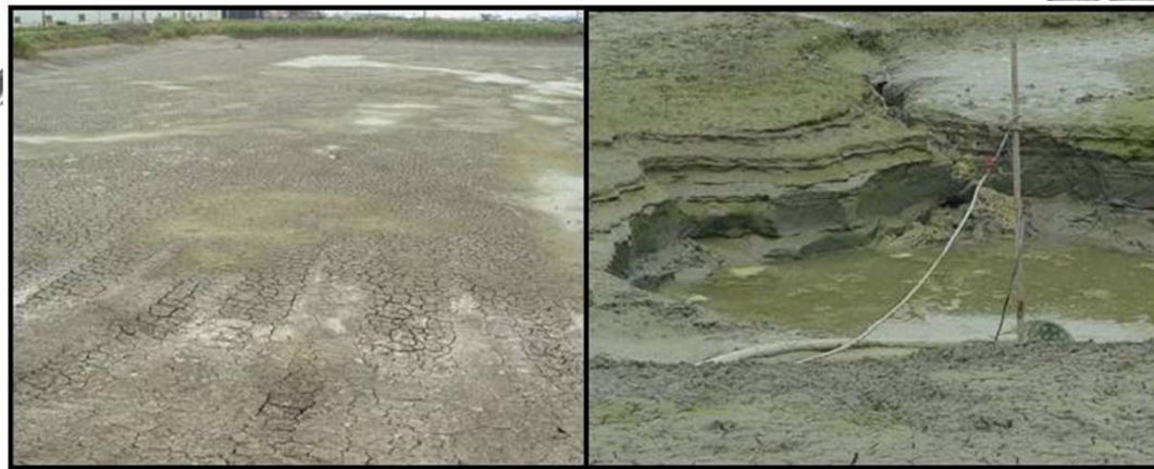
使用芽孢桿菌的魚塢 (Used)