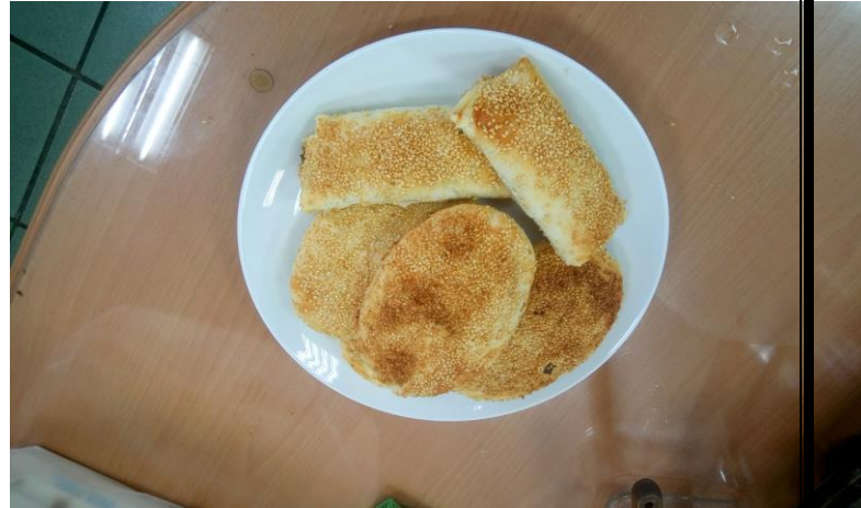
說明：今日美食-張家燒餅