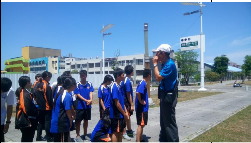
說明：參加同學於大成國中前合影