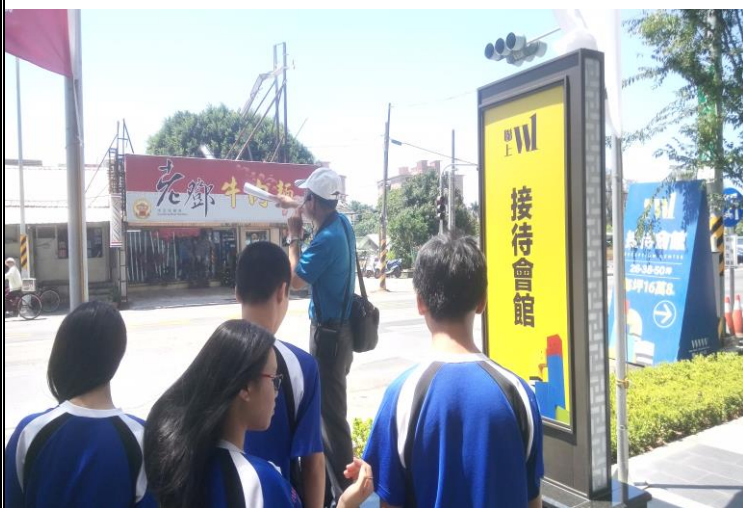
說明：介紹大成路老鄧牛肉麵的發展過程