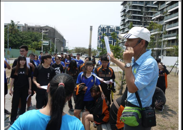
說明：街道名稱由來介紹