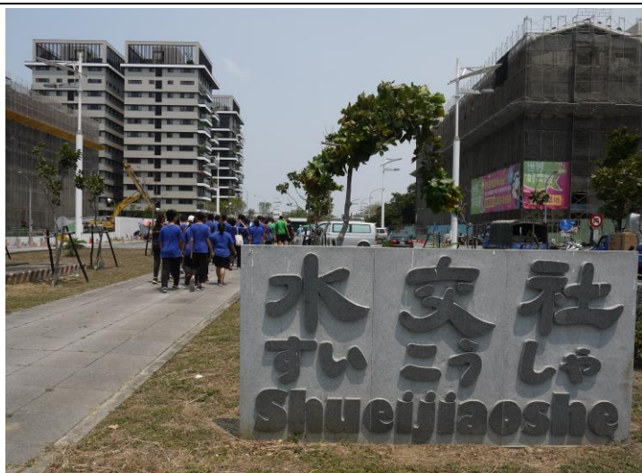
說明：水交社街道導覽