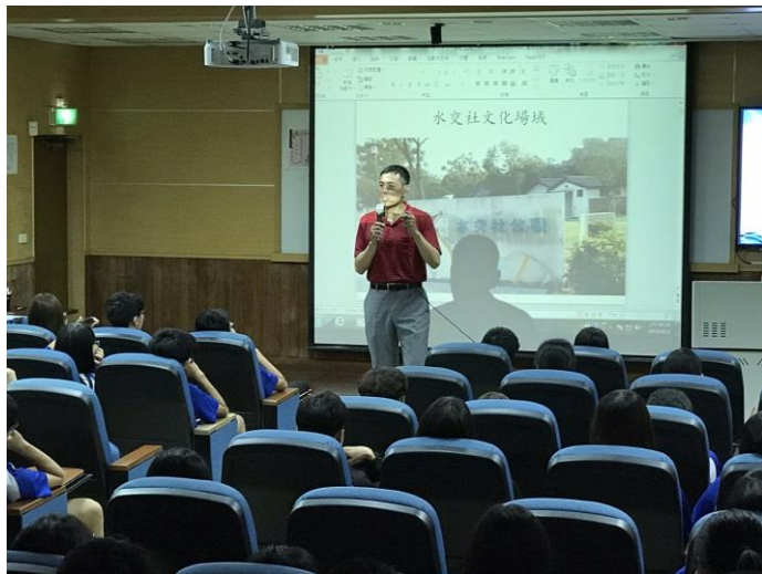
說明：校長說明水交社導覽走讀的意義