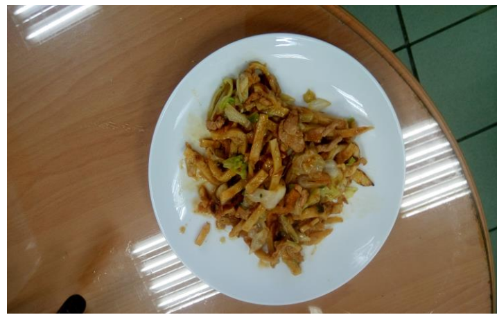
說明：金門館的炒餅