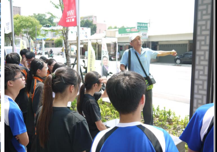
說明：講師介紹古運河及警察新村現址