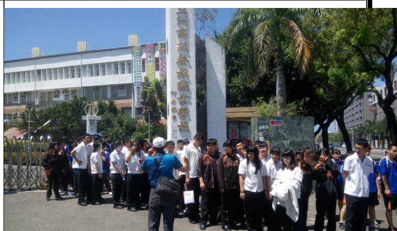
說明：從學校的發展歷史開始走讀