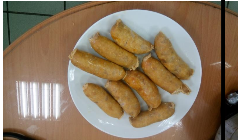
說明：今日美食-冷家的豆腐香腸